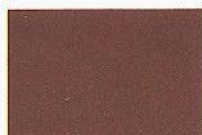
22 dunkelbraun 3331