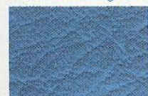
20 saphirblau 3351