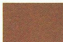
24 beige 3301