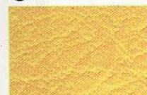
26 safran 3352