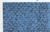
1 saphirblau 2351