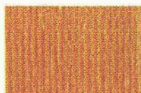
15 safran 2352