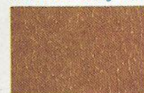
36 gemstarben 4302