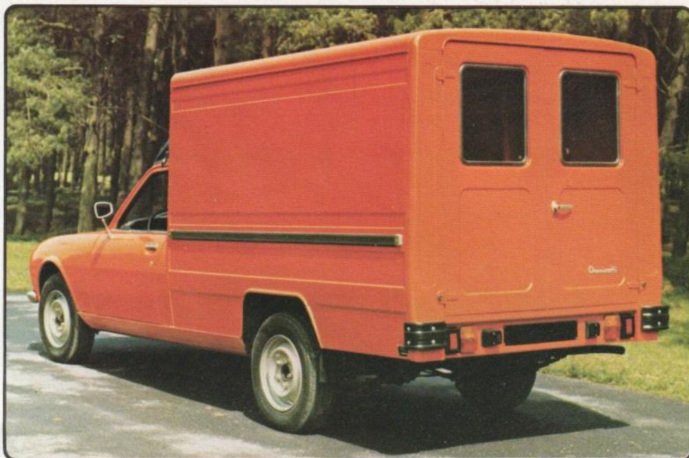
EXTRA'S : 1 - 3 - 5 - 8