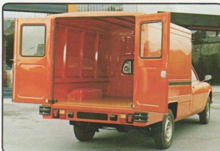
EXTRA'S : 7 - 3 - 5