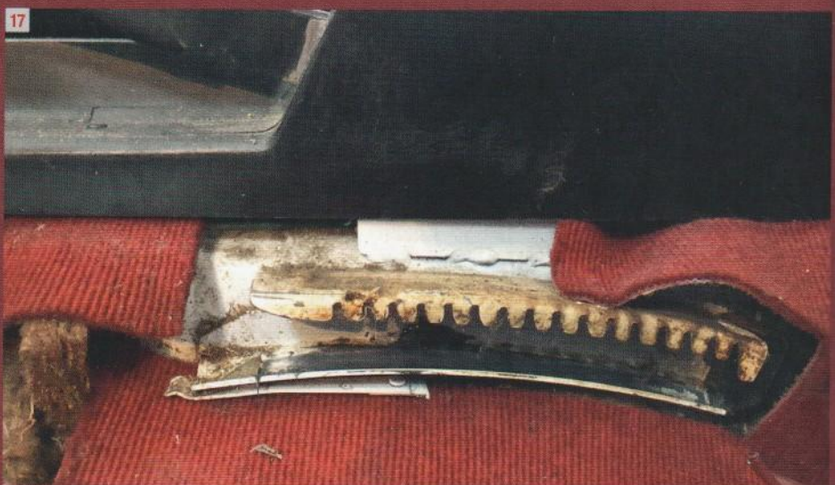
10 en 11: Het schuim heeft het goed gehouden maar kan hier en daar wat gerepareerd worden. 12 en 13: De zitting is perfect gelukt. 14: En de rugleuning ook, missie geslaagd. 15: Natuurlijk is er werk aan de rest van het interieur. 16: Een van de schuif-elementen had de geest gegeven tijdens het demonteren. 17: In deze tanden moet het plastic schuif-element schuiven, dat gaat niet met bison-kit, daar moet een andere voor komen.