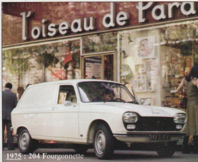
1975 : 204 Fourgonnette