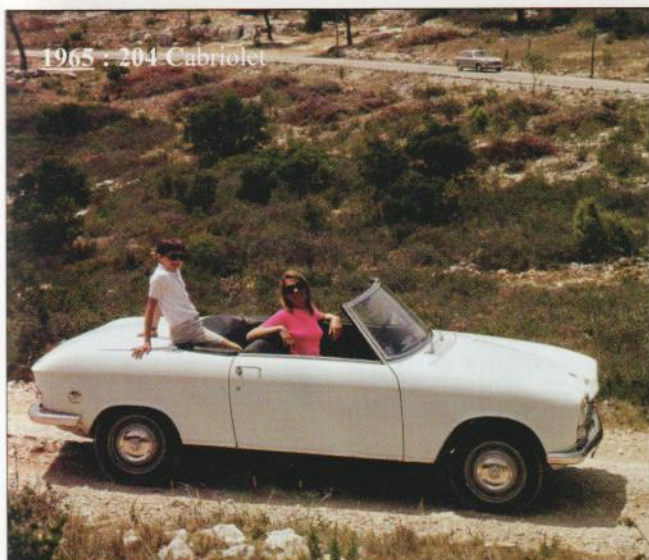
1965 : 204 Cabriolet