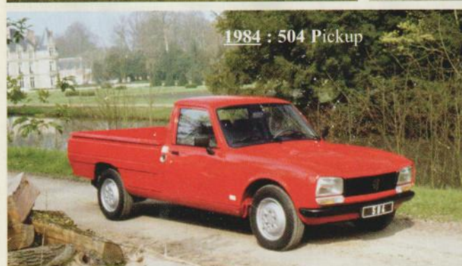
1984 : 504 Pickup