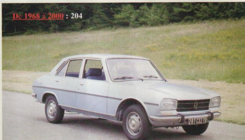
De 1968 à 2000 : 204