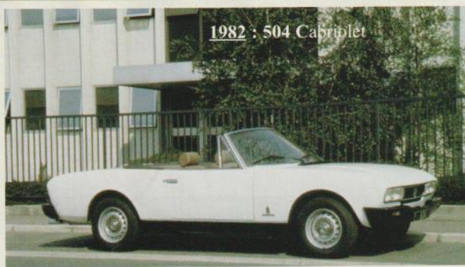
1982 : 504 Cabriolet