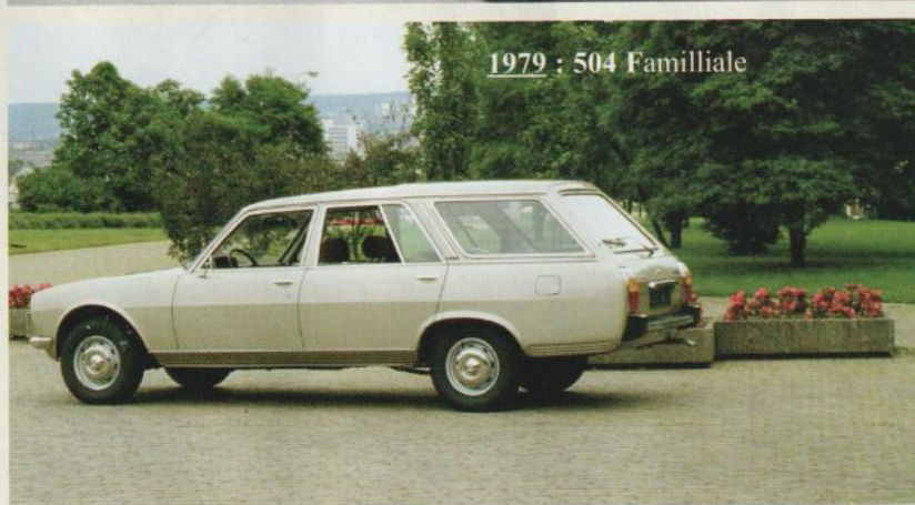
1979 : 504 Familiale