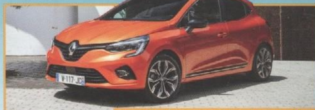
NIEUWE RENAULT CLIO