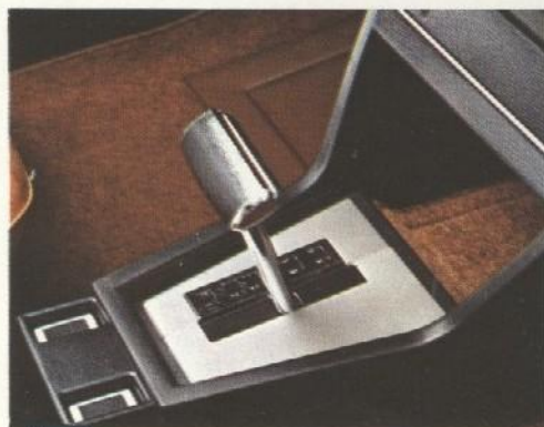
Boîte de vitesses automatique en option sur break GL essence.