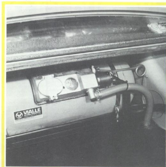
Gastank van 85 liter ingebouwd in een Peugeot 604 met speciale benzinetank. De koffervloer wordt slechts 14 centimeter korter.

Stelt u er prijs op de garantie op uw auto onverkort te zien gehandhaafd, dan kunt u eventueel ook een installatie van BK of van Landi den Hartog kiezen. De deskundigheid van de installateur, die de installatie plaatst, moet zonder meer vaststaan.