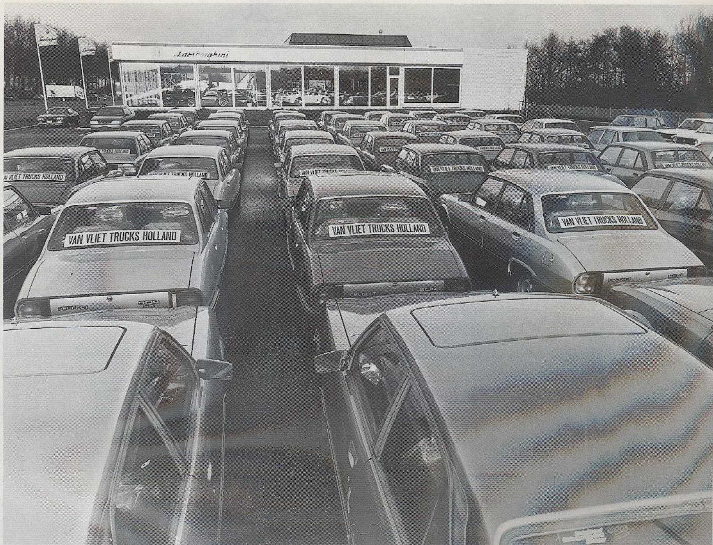
Vijftig Peugeots 504 op doorreis