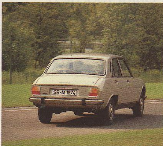
Abb.: PEUGEOT 504, Ausstattung TI

Andere bevorzugen den luxuriös ausgestatteten 504 GL mit stärkerer Maschine, 71 kW (96 DIN PS), Einzelradaufhängung vorn und hinten, Halogen-Fern- und Abblendlicht, Knüppelschaltung und vielen weiteren Details, die den Unterschied zwischen Fahren und Fahrgenuß ausmachen.