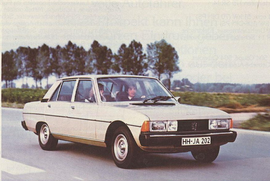
Abb.: PEUGEOT 604 SL V6

Wer die individuelle Lösung bevorzugt, wer besonders bequem reisen möchte, ohne extrem aufzufallen, kann mit dem PEUGEOT 604 Eigenständigkeit beweisen, ohne in ein traditionelles oder exotisches Extrem zu verfallen.