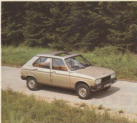
Abb.: PEUGEOT 104, Ausstattung SL mit Stahlkurbeldach

Übrigens – im PEUGEOT 104 fahren Sie stets auf Nummer sicher! Neben energieabsorbierenden Knautschzonen besitzt jedes 104-Modell 3 breite Dach-Querträger, besonders starke Dach-Seitenrahmen und eine stark verrippte Bodenanlage, was diesem Fahrzeug eine hervorragende Längs- und Querstabilität