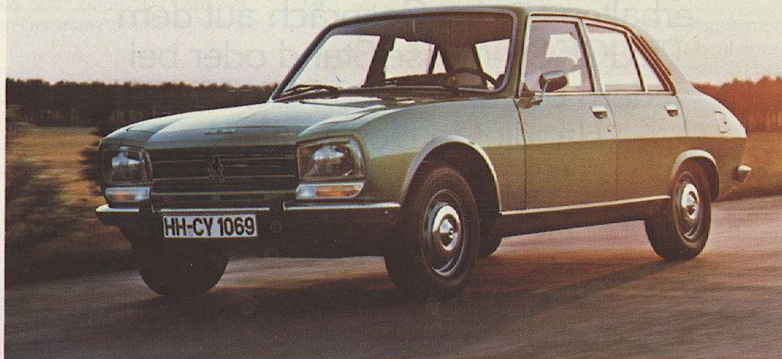
Abb.: PEUGEOT 504, Ausstattung TI

Das in jeder Hinsicht stärkste und komfortabelste Modell der 504-Limousinen ist der TI mit 78 kW-Einspritz-Triebwerk (106 DIN PS), 173 km/h, dazu Servolenkung, Stahlschiebedach, elektrische Fensterheber vorn, Drehzahlmesser – alles zusätzlich zu dem komfortablen Ausstattungspaket der GL-Version.