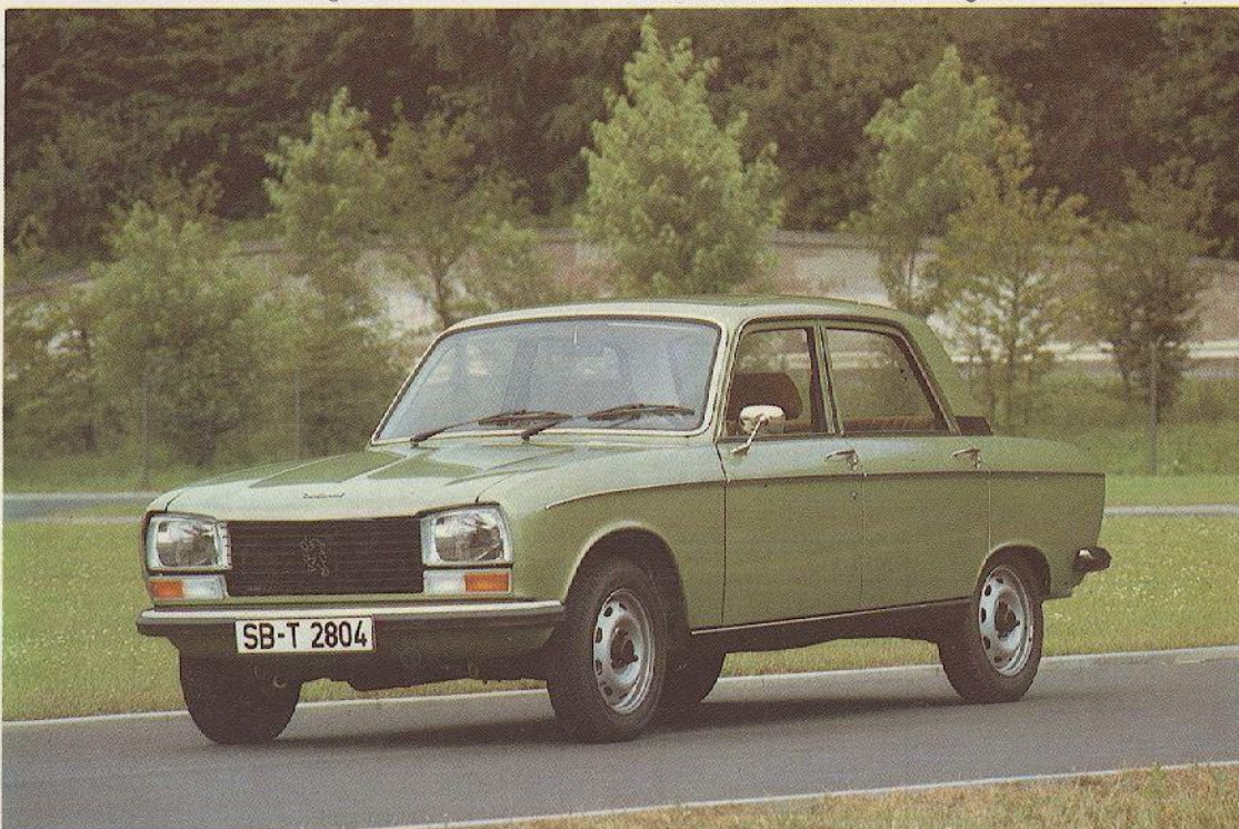
Abb.: PEUGEOT 304, Ausstattung SLS