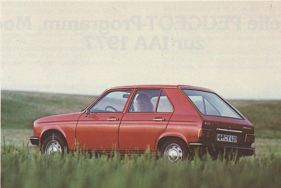
Abb.: PEUGEOT 104, Ausstattung SL

verleiht. Weiterhin trägt zur Sicherheit das aufwendig konstruierte PEUGEOT-Fahrwerk mit langem Radstand bei. Alle Räder sind einzeln aufgehängt. Ein Kurvenstabilisator sorgt für ausgezeichnetes Fahrverhalten. Das Zweikreis-Bremssystem mit druckabhängigem Bremskraftregler garantiert schnellen und sicheren Halt.