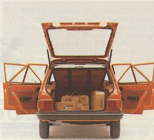
Abb.: PEUGEOT 104, Ausstattung SL