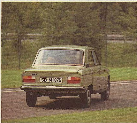
Abb.: PEUGEOT 304, Ausstattung SLS

Viele nützliche Dinge wie beleuchtete Heizungsbedienungshebel, abblendbarer Innenspiegel, Lichthupe, Mittelkonsole vorn mit Ablage, elektrische Scheiben-Wischwasch-Anlage, Zigarettenanzünder machen das Fahren im PEUGEOT 304 GL noch angenehmer. Für gute Sicht nach hinten sorgt die beheizbare Heckscheibe, für gutes Klima das stufen-