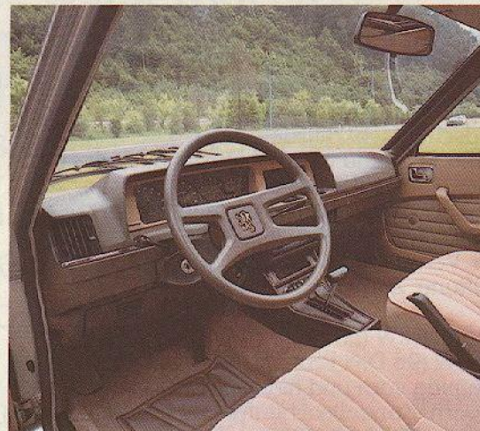
Abb.: PEUGEOT 604 SL V6 Automatik