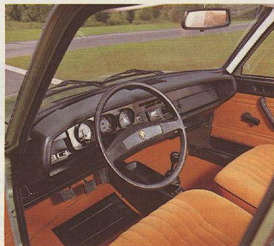
Abb.: PEUGEOT 304, Ausstattung SLS