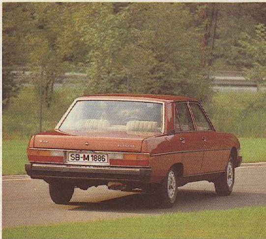
Abb.: PEUGEOT 604 SL V6

Das neue Spitzenmodell im breiten PEUGEOT-Programm heißt PEUGEOT 604 V6 TI. Noch komfortabler durch rundum getönte Scheiben, elektrisch betätigtes Stahlschiebedach und elektrisch versenkbare Türscheiben vorn und hinten, zentrale Türverriegelung. Noch überlegener und leistungsfähiger durch den 144 DIN PS-Einspritzmotor mit 5-Gang-Getriebe.