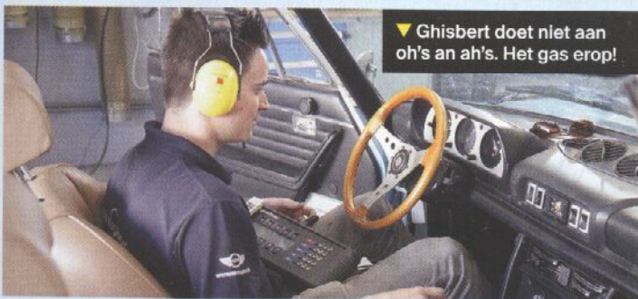
▼ Ghisbert doet niet aan oh's an ah's. Het gas erop!