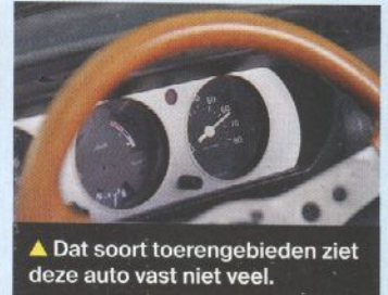
▲ Dat soort toereengebieden ziet deze auto vast niet veel.

► Als je deze Peugeot ziet, vraag je je af wanneer het precies mis is gegaan met het huidige auto-design.