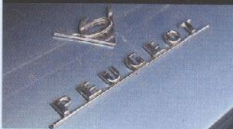
▼ We moesten diep in ons geheugen graven voor de Peugeot 504 V6 cabrio.

'Het is nog steeds mogelijk om er 185 km/h mee te rijden, maar dat doe ik natuurlijk sporadisch; 130 km/h vindt hij prettig'