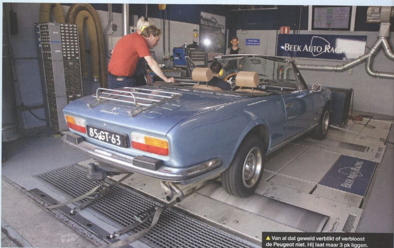
▲ Van al dat geweld verblijft of verbloost de Peugeot niet. Hij laat maar 3 pk liggen.