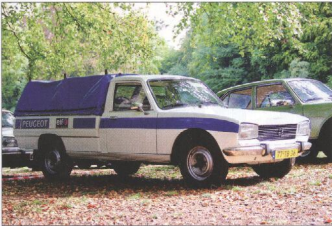
Zie je niet vaak. Een 504 Pick-Up in blakende gezondheid