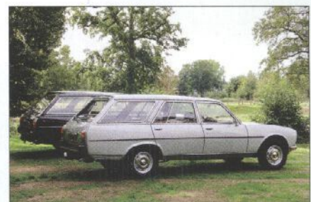
De 504 GR Familiale op de voorgrond was bijzonder heel fraai