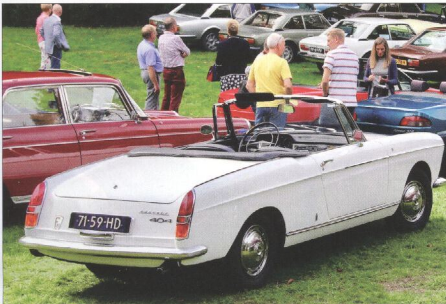
Ook op de 504 verjaardag konden wij deze prachtige 404 Cabriolet onmogelijk negeren