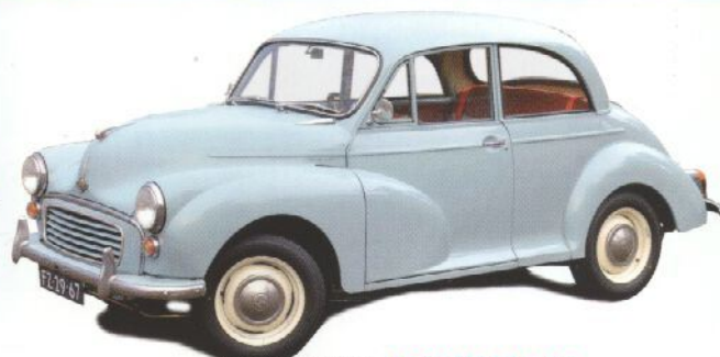
RESTAURATIE: MORRIS MINOR