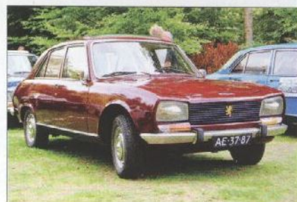
Eén van de vele goed bewaarde 504 Berlines in Doorn