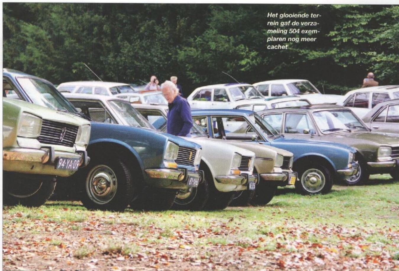
Het glooiende terrein gaf de verzameling 504 exemplaren nog meer cachet