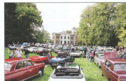
Het samenspan van klassieke Peugeots in Doorn was imponerend