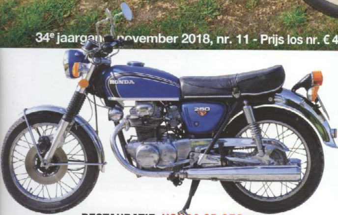
RESTAURATIE: HONDA CB 250

34 e jaargang november 2018, nr. 11 - Prijs los nr. € 4,99 - bij abo slechts € 3,-