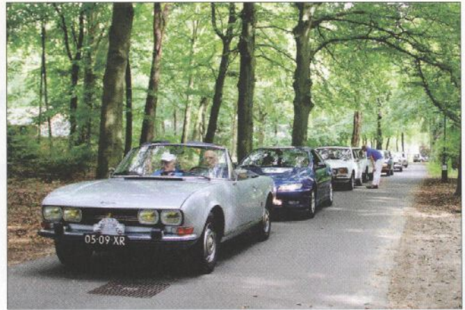
Diverse Peugeots in de startrij voor de rit over de Utrechtse Heuvelrug