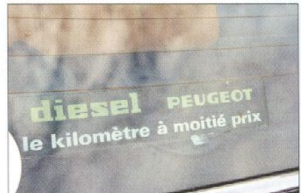
Een origineel Frans etiket aan de binnenzijde van de achterraut blijft speciaal