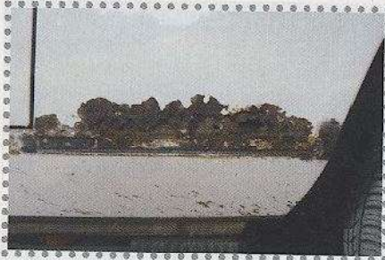
Dat is dus krokant. Bij het uitslijpen en later pasmaken van de inzetplaat is uiterste nauwkeurigheid betracht