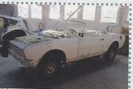
De lijn van veel Franse automobielen valt of staat bij een perfect strak gemaakte ondergrond