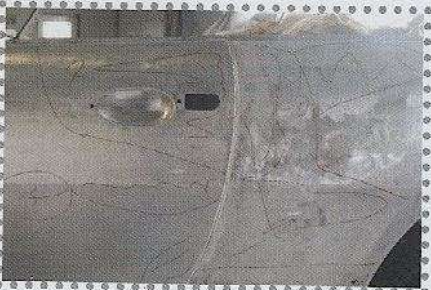
Geen moderne kunst, maar elke lijn betekent een imperfectie die nog opgeheven moet worden