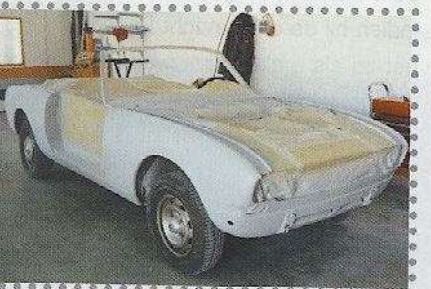
Strak gemaakt en klaar voor de spuitcabine