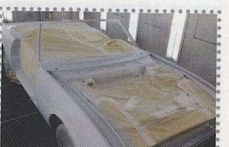
Natuurlijk was de auto voor het spuiten ontlast van deuren en glaswerk