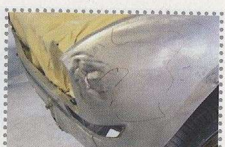
Bij het kaal maken bleek dat deze cabrio onder lak en plamuur unieke stukjes kreukelzone had