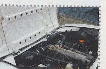
Net als in onze rubriek 'Onder de kap gekken'. Dit had een schoolvoorbeeld kunnen zijn. ZGAN met behoud van authenticiteit