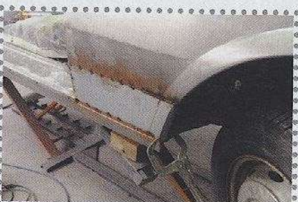
Natuurlijk werd het reparatieplaatwerk haarscherp pas gemaakt om daarna spanningsvrij ingelast te worden. Dat resulteerde in een minimale hoeveelheid benodigde plamuur achteraf