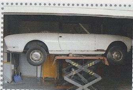
Op de brug en zonder strips liet de 504 zien dat de tijd niet ongemerkt aan hem voorbij was gegaan