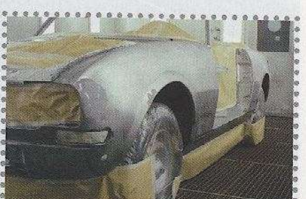
De zoveelste fase in het strakmaken. De ingelaste delen vragen nauwelijks aandacht, de uitgedeukte iets meer. Hier is het plaatwerk 'geneveld' om de strakheid te controleren