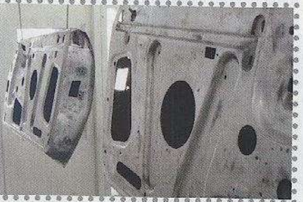
De deuren zijn los van de auto gespoten. Omdat de Peugeot niet in een metallic lak gezet is kan dat probleemloos en zonder 'kleuromlagen'