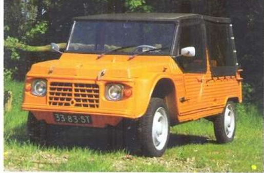
p32 | Méhari kopen?