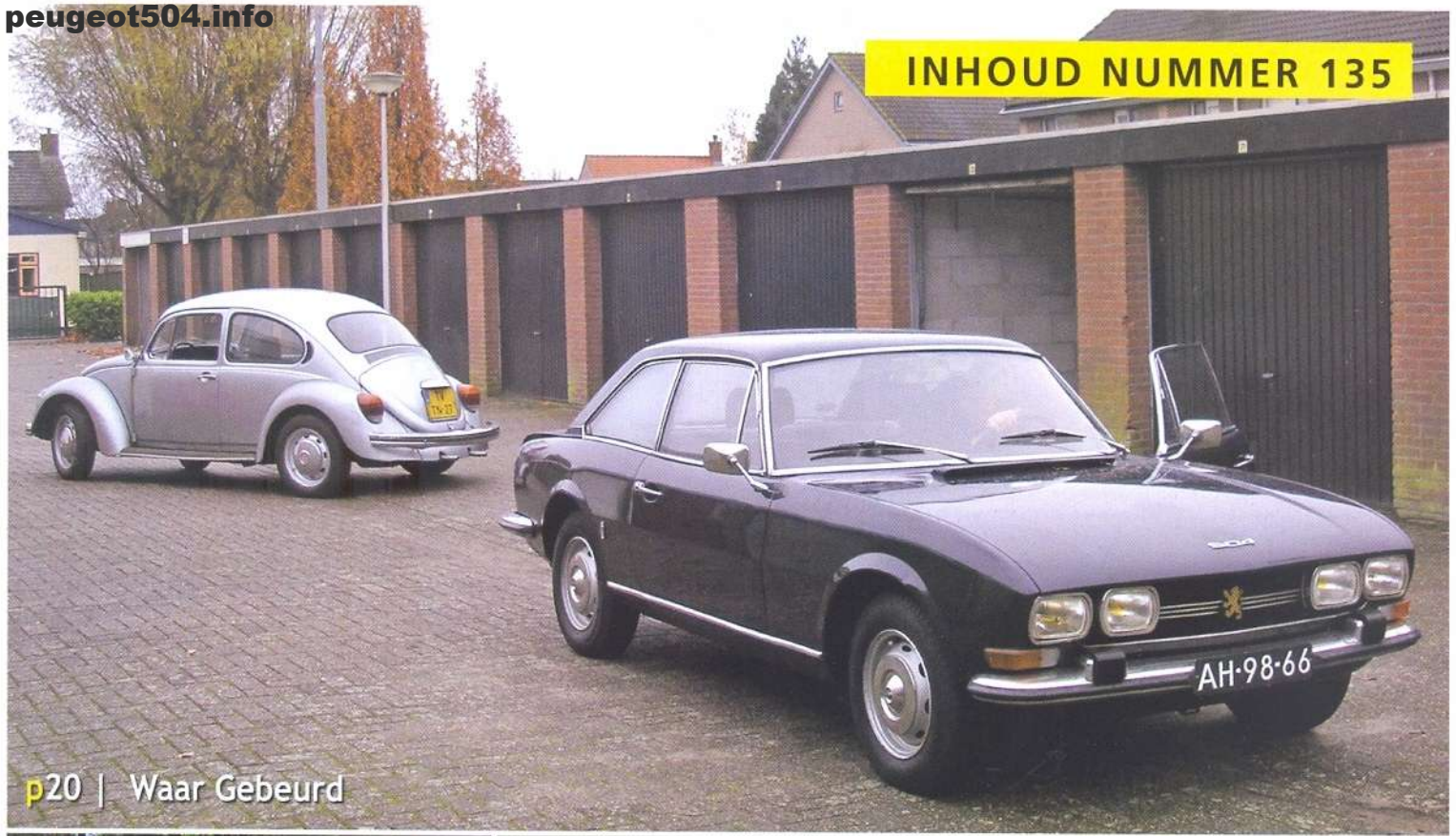
p20 | Waar Gebeurd