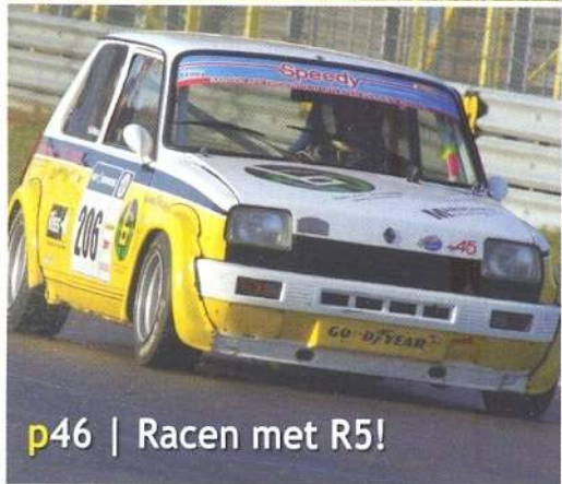
p46 | Racen met R5!