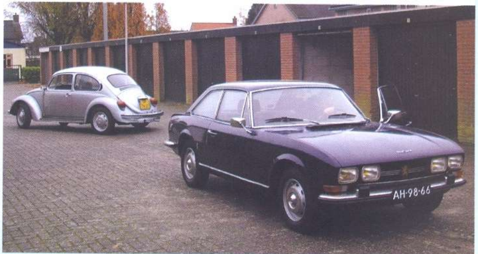
Mexicokever met de Frankrijkcoupé.