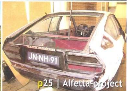
p25 | Alfetta-project