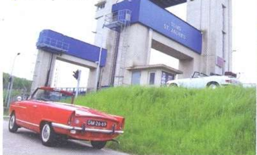
p33 | Toerenmachientjes