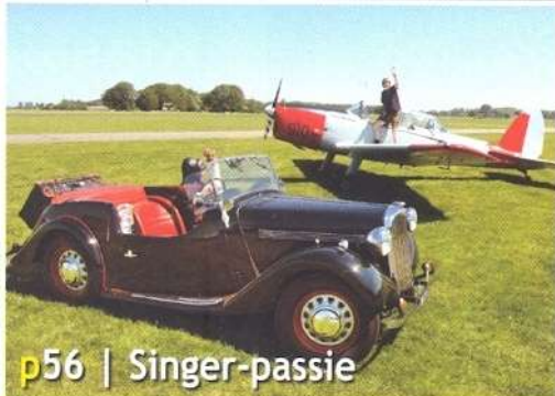
p56 | Singer-passie