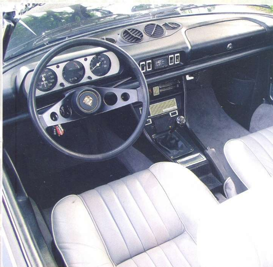
De heerlijk zittende fauteuils zijn bekleed met leer in twee tinten lichtgrijs. Het instrumentenpaneel heeft dezelfde vorm als dat van de 504 Berline, het dashboard is echter behoorlijk anders.

Of ze waren niet rijdbaar, of er mankeerde van alles aan de techniek, of hij kreeg te maken met een eersteklas wrak