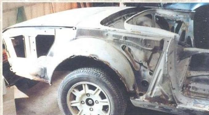
Bewijsstukken dat er kosten noch moeite bespaard zijn om de Peugeot 504 Cabriolet V6 weer in prachtige conditie te brengen. De vorige eigenaar heeft na voltooiing van de restauratie maar weinig van de auto kunnen genieten...

En mooi is de auto. De donkerblauwe lak staat de 504 fantastisch en vormt een prachtige combinatie met de verchromde bumpers en het lichtgrijze, lederen interieur. We kunnen ons goed voorstellen dat Ben van Delden in de Peugeot 504 Cabriolet V6 zijn ideale auto zag. Een alom gewaardeerde carrosserievorm naar ontwerp van Pininfarina, een krachtige (en als je je inhoudt niet heel dorstige) V6-motor, een zachtgeveerd onderstel en een luxueus ingerichte, gastvrije verblijfsplaats achter het stuur. Wat wil een mens eigenlijk nog meer? ■