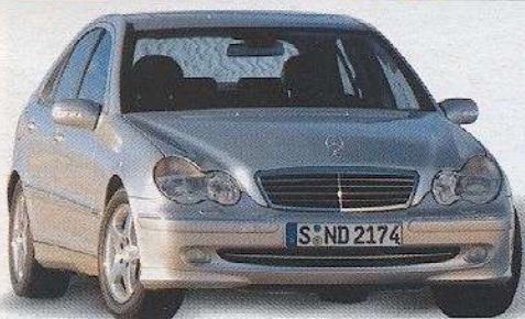
Nieuwe Mercedes C-klasse