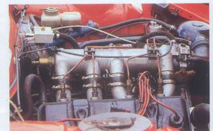
Problemlos mit G-Kat nachrüstbar: Zweiliter-Vierzylindermotor