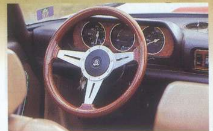
Komplette Instrumentierung, Holzlenkrad als Werkszubehör