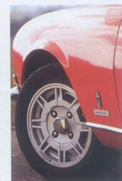
Die Leichtmetallräder betonen die dezente Eleganz des 504