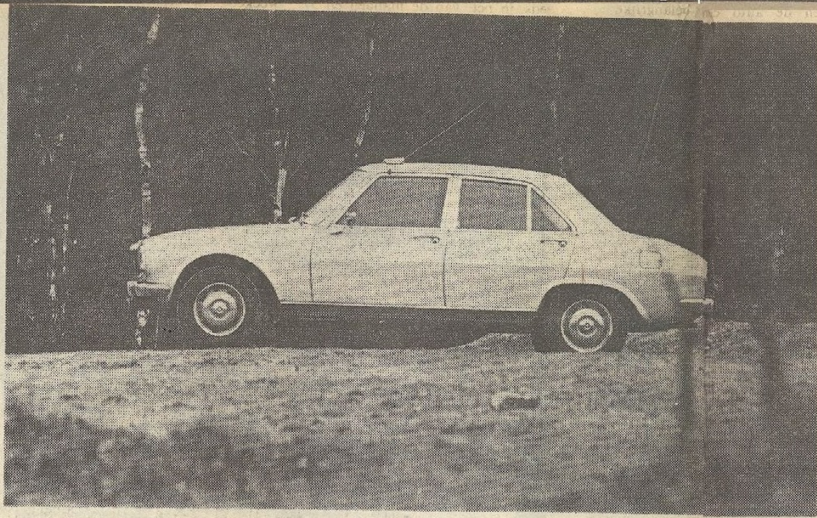
● Karakteristiek voor de profielijn van de Peugeot 504 is de knik ter hoogte van de kofferruimte.

Met een dergelijk prijskaartje op de neus is de Peugeot 504 bepaald