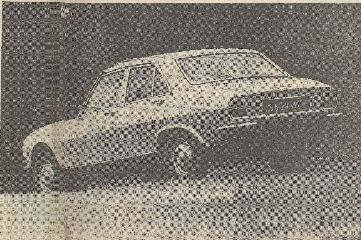
● De Peugeot 504 heeft een duidelijk eigen gezicht, van welke kant je hem ook bekijkt.