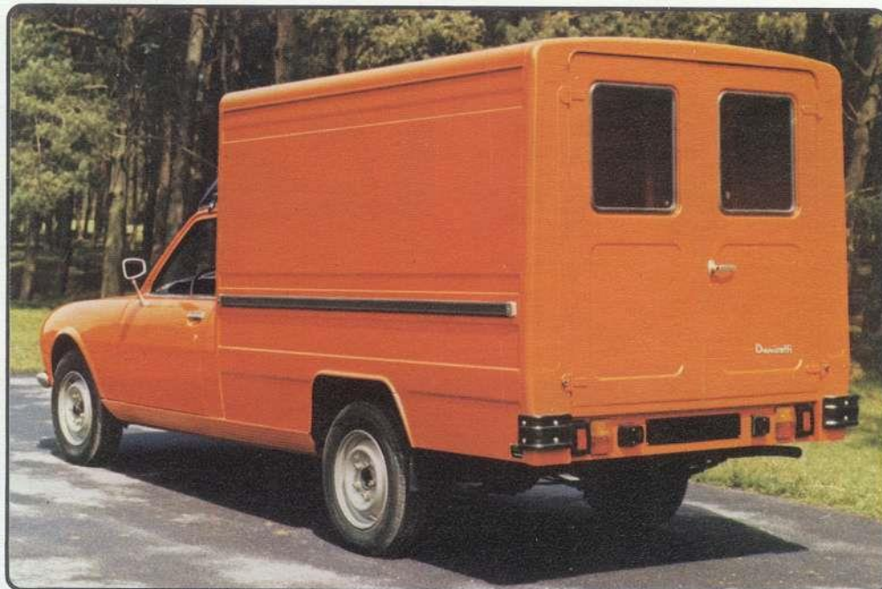
OPTIONS : 1 - 3 - 5 - 8