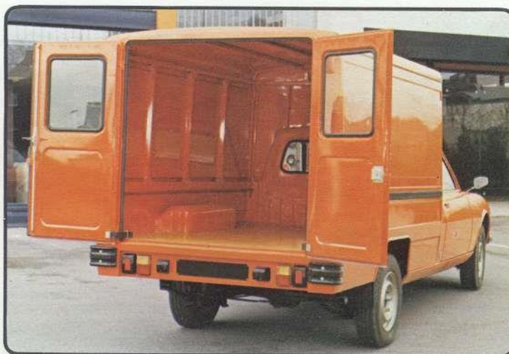
OPTIONS : 7 - 3