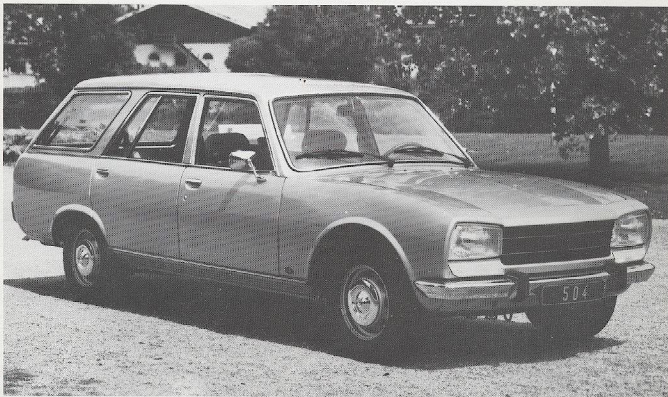
PEUGEOT 504 BREAK GR

BREAK – BREAK GR – FAMILIALE – BREAK DIESEL – BREAK GRD FAMILIALE DIESEL