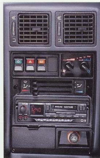
Aire acondicionado integral.

Diseño de tapizados Varese que combina perfectamente con el interior del vehículo.